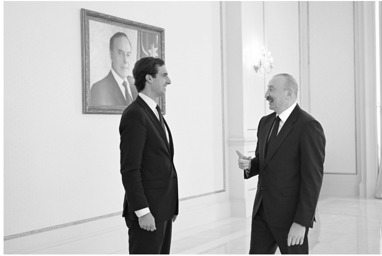
mından yaxşı imkan yaratdığı bildirildi. Dövlətimizin başçısı "Bakı Enerji Həftəsi" çərçivəsində imzalanmış sənədlərin əhəmiyyətinə də toxundu.

Son dövrlərdə ikitərəfli münasibətlərimizin uğurlu inkişaf etdiyini deyən dövlətimizin başçısı Azərbaycanla ABŞ arasında imzalanmış Strateji Tərəfdaşlıq Xartiyasının, həmçinin bu Xartiyaya əsasən müxtəlif sahələr üzrə əməkdaşlığın inkişaf etdirilməsi üçün işçi qruplarının yaradılmasının əhəmiyyətinə toxundu. Azərbaycan-ABŞ İqtisadi Dialoqunun ilk iclasının keçirilməyini vurğuladı. Bu xüsusda Kaleb Orrun başçılıq etdiyi nümayəndə heyətinin ölkəmizə səfərinin əməkdaşlığın perspektivlərini müzakirə etmək baxı-